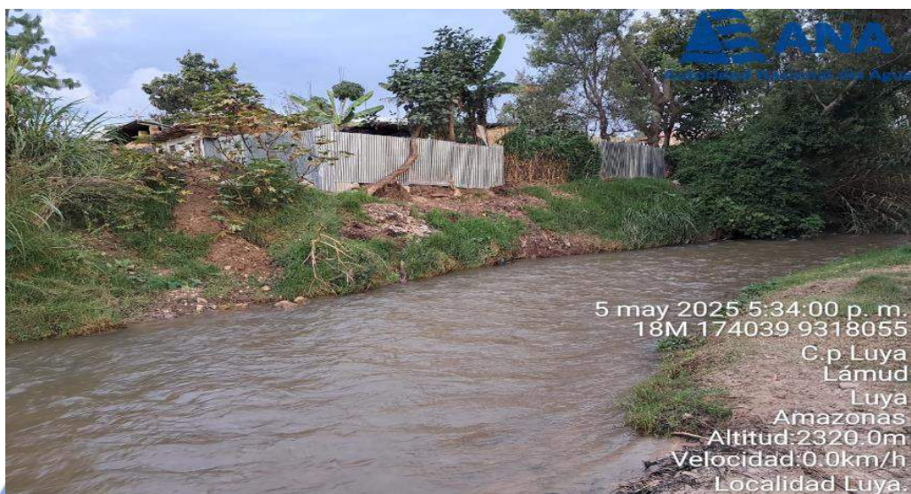
FIGURA N°03: EN LA TEMPORADA DE MAXIMAS AVENIDAS, EL RÍO JUCUSBAMBA SE DESBORDA EN ESTE TRAMO DEL DISTRITO DE LUYA, ARRASANDO CON TODO LO QUE ENCUENTRA A SU PASO.