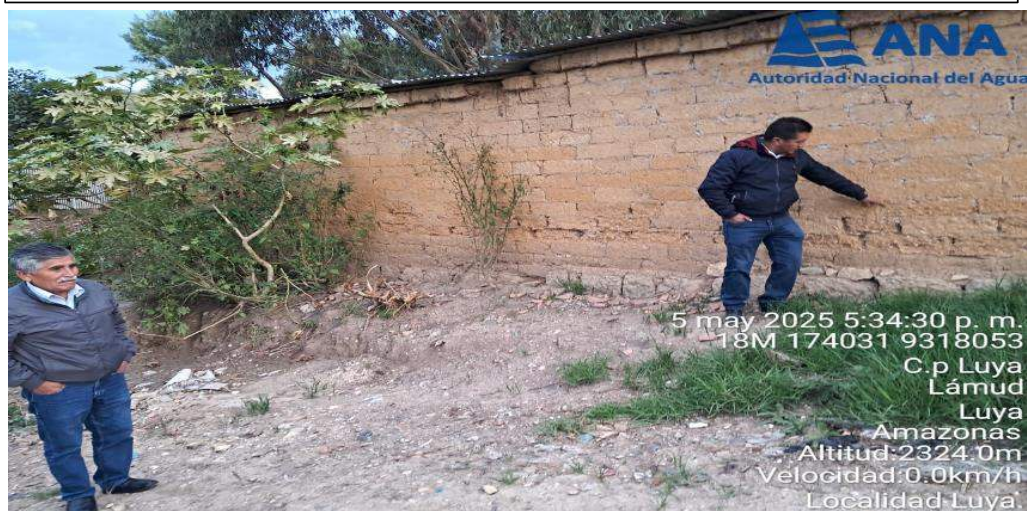
FIGURA N°02: VIVIENDAS EXPUESTAS ANTE UNA CRECIDA DEL RÍO JUCUSBAMBA EN LA MARGEN DERECHA