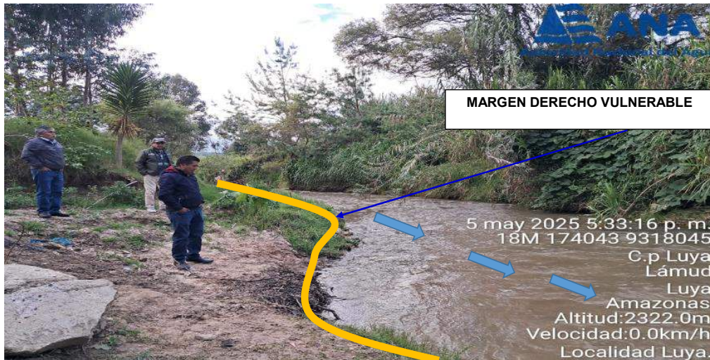
FIGURA N°01: TRAMO CRÍTICO EN EL RÍO JUCUSBAMBA , EN EL DISTRITO DE LUYA, PROVINCIA DE LUYA -